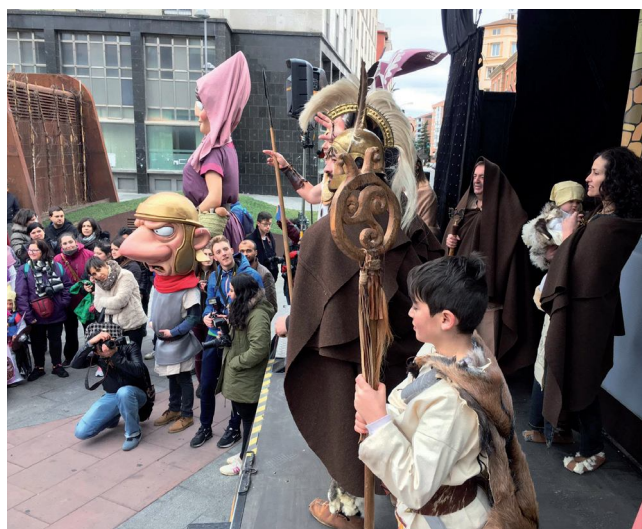
Participación colegios de Soria Carnaval 2017

28- Participación en el carnaval de Soria: para mostrar Numancia de manera más lúdica se realizó un pequeño espectáculo didáctico en la plaza Mariano Granados frente a muchos niños sorianos en cuyos colegios habían tomado la temática celtibérica como motivo para sus disfraces.