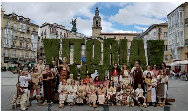
Presentación juego en Vitoria

9- Presentación del videojuego “Numantia” en Vitoria: Tierraquemada se desplazó a Vitoria para apoyar la presentación del video juego Numantia que la empresa Reco Technology ha realizado basándose en las gestas numantinas. 70 personas arroparon con su presencia la presentación, además se realizó un espectáculo didáctico en la Plaza Mayor de Vitoria en el que sus habitantes pudieron disfrutar, en primer lugar, de un desfile de las tropas de Escipión y del pueblo romano. El encuentro entre ambos culminó con el Reto en que los máximos caudillos explicaron su postura.