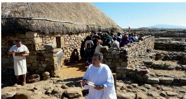
Jornada de Puertas Abiertas

cia: segunda de las citas de la Asociación en el yacimiento de Numancia. Sin duda una de las actividades más pertinentes, agradecidas y mejor recibidas por el público a tenor de las cifras de visitantes que se alcanzaron ese día, más de un millar.