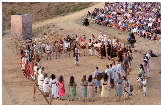
Representación La Caída de Numancia