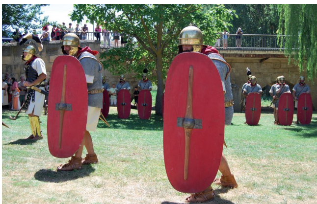
Espectáculo mañana de la representación