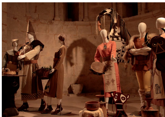
Exposición Almazán - diciembre 2017

15- Elaboración, montaje y gestión de visitas de la exposición "Numantikón. El legado de Numancia": el Ayuntamiento de Almazán, dada la estrecha vinculación histórica de esta villa con la ciudad de Numancia, se ha querido sumar a la conmemoración de Numancia 2017 encargando a Tierraquemada esta muestra sobre la cultura celtibérica que se puede visitar hasta el 18 de febrero en el Aula Cultural San Vicente de esta localidad.