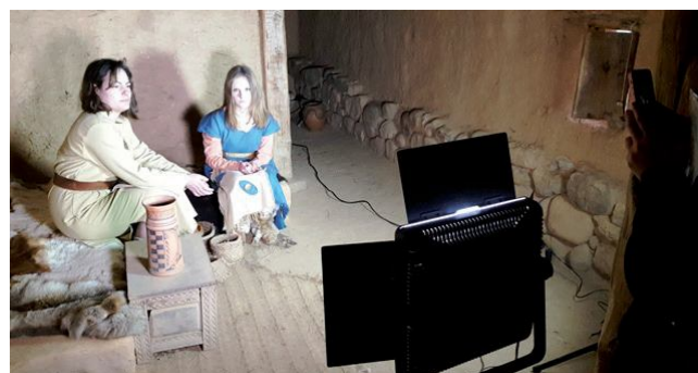
Grabación del documental Numantina

18 y 19- Realización del cartel de la representación 2017: otro trabajo audiovisual, en este caso la recreación en movimiento del cuadro de Alejo Vera sobre los últimos momentos de Numancia, encarnados los personajes por miembros de la Asociación.