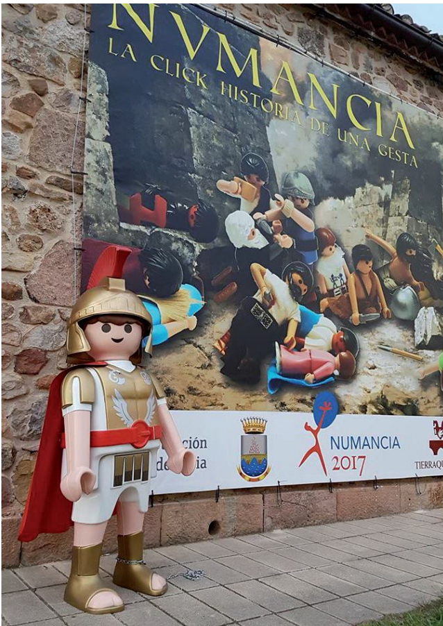
Exposición Clicks Playmobyl 2017

25- Inauguración del diorama de los Playmobil de la caída de Numancia: una de las acciones que en poco tiempo han demostrado ser más acertadas y que mayor interés ha generado ha sido el diorama instalado en el Aula Arqueológica de Garray y creado con más de 1.500 muñecos de Playmobil en el que se recrean varios de los episodios de la caída de Numancia así como una parte de Roma. Al cierre de esta revista habían visitado esta muestra más de 35.000 personas.