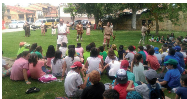
Espectáculo didáctico La Vida y La Guerra para colegios de Soria