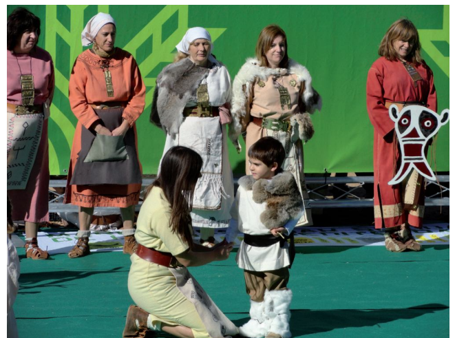
Ruta dieta Mediterranea

22- Marcha Dieta Mediterránea: En colaboración con la Fundación Científica de Caja Rural se puso el colofón a la primera marcha por la dieta Mediterránea que se realizó desde Soria hasta Garray, con un espectáculo didáctico por parte de la Asociación junto al río Tera.