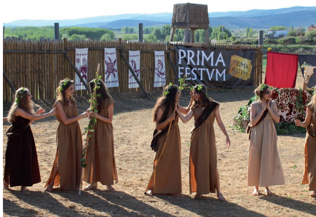
Prima Festum 2017