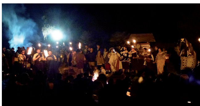
Samain octubre 2016