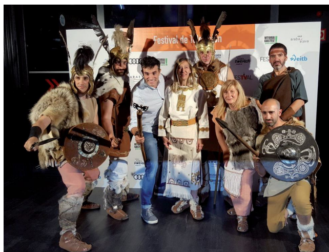
Presentación FestVal 2017

9- Participación en la presentación del Festival de Televisión de Vitoria: varios miembros de la Asociación viajaron hasta Madrid para la presentación de este festival que se celebrará en septiembre y en el que se producirá el estreno mundial del video juego “Numantia”, que Sony Playstation Talent ha desarrollado y que se distribuirá en más de 80 países.