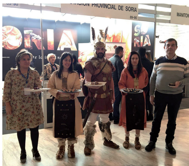
Feria Gastronómica Madrid Fusión 2017

23- Participación en Madrid Fusión: Varios miembros de la Asociación se desplazaron hasta Madrid para colaborar con Numancia2017 en Madrid Fusión. A través de Diputación Provincial de Soria se presentó un menú celtibérico. Varios medios a nivel nacional se hicieron eco de la noticia.